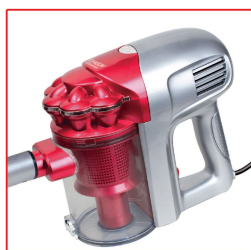
Scopa elettrica ciclonica Cyclonic electric broom

Dimensioni prodotto: 295 x 110 x 210 mm Dimensioni imballo: 420 x 175 x 295 mm Peso imballo + prodotto: 2.5 Kg Pezzi x master 4 pz Dimensioni master: 730 x 440 x 325 mm Peso master: 11.2 Kg Pezzi x pallet: 60 Colli x strato: 5 Strati: 3 Altezza pallet: 230 cm Peso pallet: 188 Kg Container 20: 1176 pz Container 40: 2352 pz Container 40 HQ : 2684 pz Codice certificazione: HL-806B2