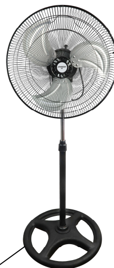
VENTOLA 3 PALE IN ACCIAIO