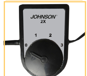
SELETTORE DI VELOCITA'